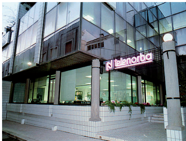
Conversano La sede dell'emittente pugliese Telenorba

Telenorba è stata media partner della Notte bianca a Lecce. evento nella città barocca. Così come Radionorba, che, dopo il grande successo della scorsa edizione, è stata riconfermata radio ufficiale della manifestazione. Ore piccole, dunque, sabato scorso, su TN7 per una notte che si è consumata all'insegna dell'arte, della musica, della cultura, del divertimento; in altre parole, una notte dedicata a chi aveva ancora voglia di sognare come recita il pay off della manifestazione. Una visione glo-