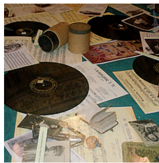
Rarità discografiche e non solo alla Mostra mercato del disco da collezione di Mercato San Severino

rarità discografiche. Non solo dischi a 45 giri, il cui boom si è registrato proprio negli anni 60-70, e long-playing saranno in esposizione ma anche cassette, cd, libri, spartiti e stampe, molte in originale, provenienti da vari Paesi ed anche dalla Cina. Grande attesa e curiosità da parte degli studiosi e dei cultori della musica d'epoca i quali hanno registrato in agenda l'appuntamento della due giorni di Mercato San Severino, incontro che darà spazio anche alla solidarietà, considerato che parte del ricavato degli incassi sarà devoluto in beneficenza. Nel corso della mostra mercato saranno presentati il libro di Massimo Forni sul progressive italiano, «Lungo le vie del